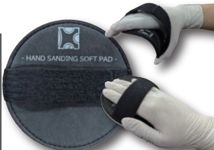
125mm のマジックタイプに対応

厚さ5mmのパッドでしっかりとした サンディングが行えます 柔軟性のあるパッドのため逆アールにもしっかりと追従 マジック式ペーパーを貼り付けるだけで使用可能 また手の固定にはマジックテープで サイズ調整を行えます 折り曲げても石飛びが少ないサンマイトペーパーと 合わせるとより作業効率が上がります